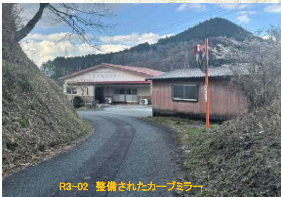
R3-02 整備されたカーブミラー