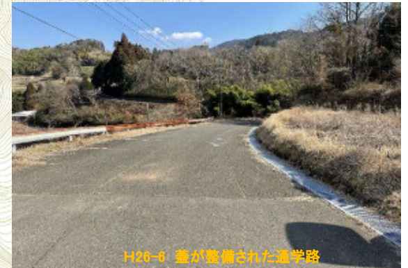
H26-6 蓋が整備された通学路