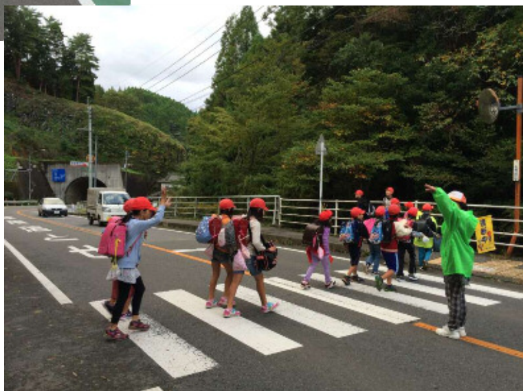
三ヶ所小学校児童が、毎朝、地域の見守り隊の方に見守られ登校の様子