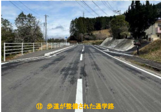
⑬ 歩道が整備された通学路