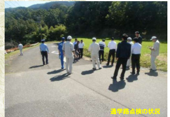
通学路点検の状況