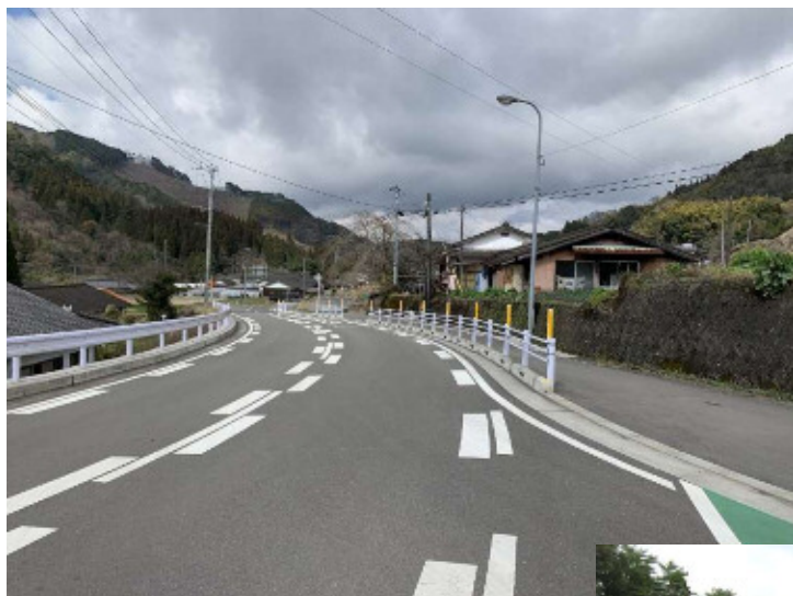
安全が確保された歩道（坂本小学校区）