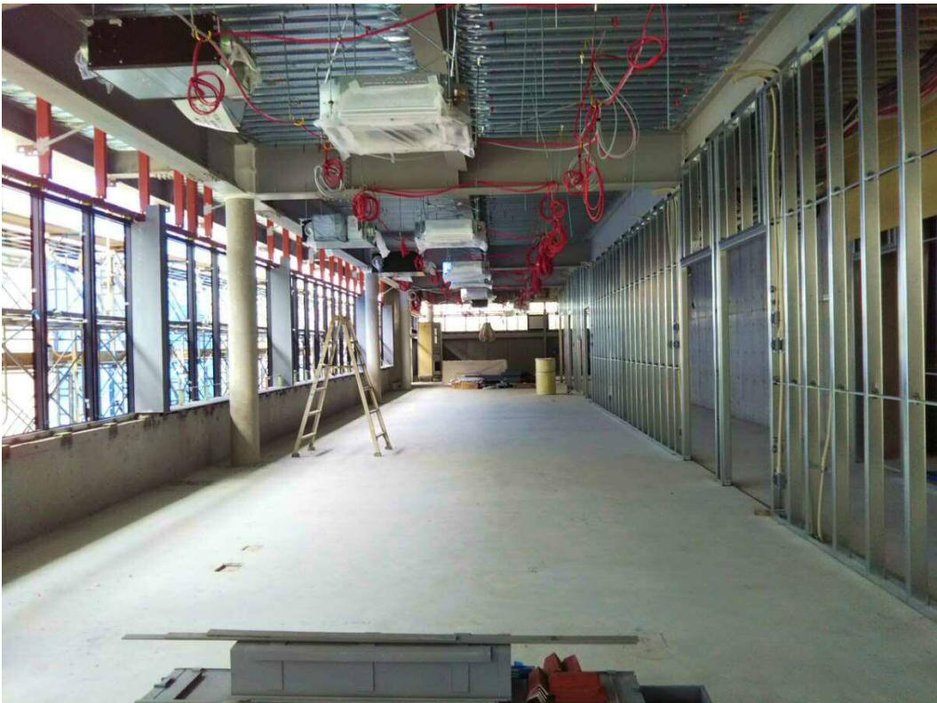
3月27日 2階の壁間仕切り、天井配管・機械吊り込み状況 (壁のボード等を貼る前に配線・コンセントボックスなどの仕込みを行います。)