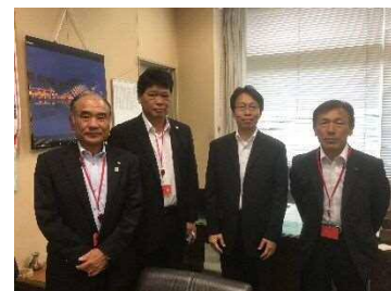
(国土交通省道路局)