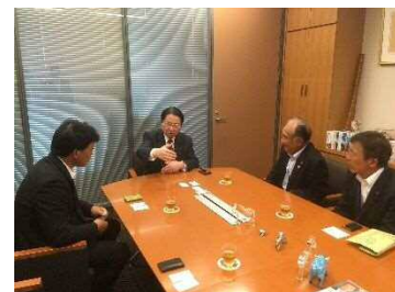
(衆議院議員第一会館)