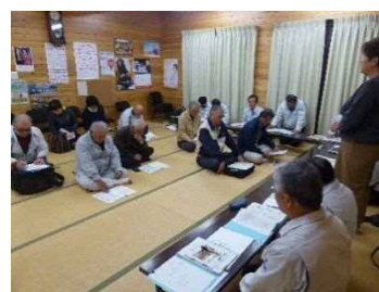
(赤谷集落センター)