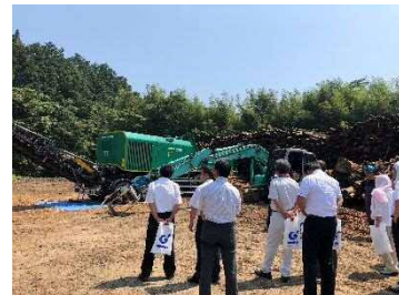
(ウッドハッカー視察)