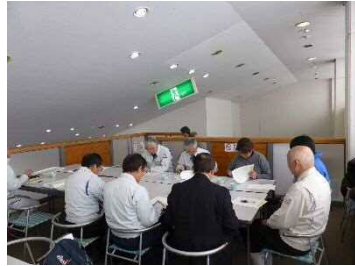
（宮野常務・藤本課長の説明）