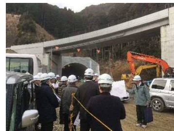
(日之影町 深角 IC)