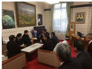
（鎌原副知事へ面会）