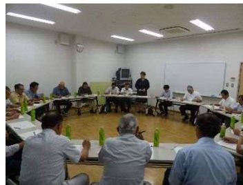
(五ヶ瀬ワイナリー会議室)