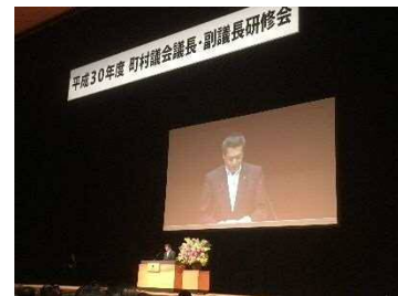
(東京国際フォーラム)