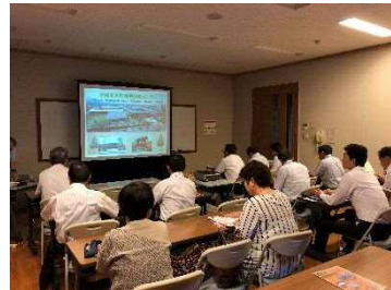
(木材利用技術センター)