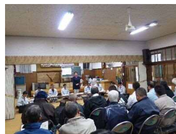
(桑野内生活改善センター)