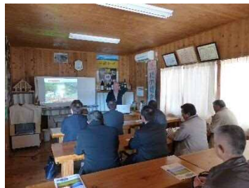
（黒木代表による説明）