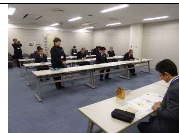
(国土交通省九州地方整備局)