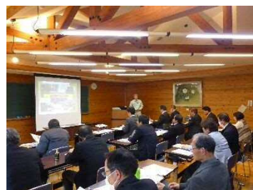
(県林業技術センター)