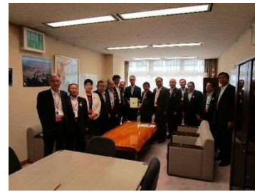
（国土交通省増田技術総括審議官）