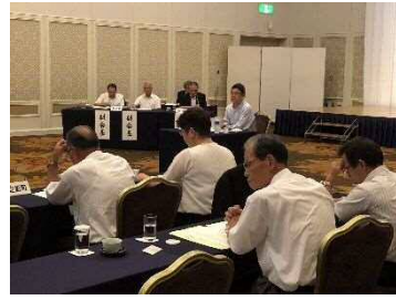
(宮崎県知事との意見交換)