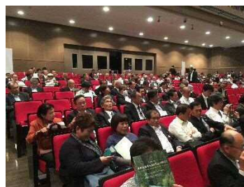
(ホルトホール大分)