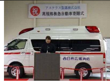
(祝辞を述べる小笠議長)